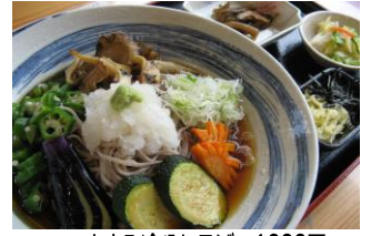
こまゆみ冷やしそば 1000円