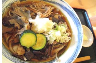
青木村特産 タチアカネ使用 きのこそば 1200円