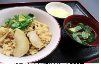
松茸ごはん(お吸物付) 1,300円