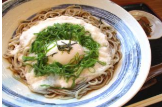
青木村特産 タチアカネ使用 冷やしとろろそば 1100円