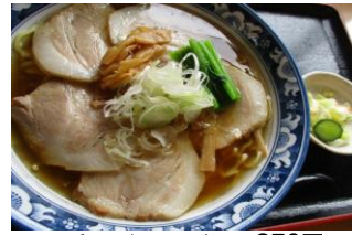
チャーシューメン 850円