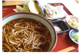
青木村特産 タチアカネ使用 天ぶらそば 1250円