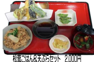
松茸ごはん&天ぶらセット 2,000円 ・松茸ごはん 松茸のお吸いもの ・天ぶら ・小鉢 お新香