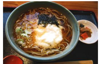
青木村特産 タチアカネ使用 とろろそば 1100円