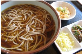
青木村特産 タチアカネ使用 掛けそば 880円