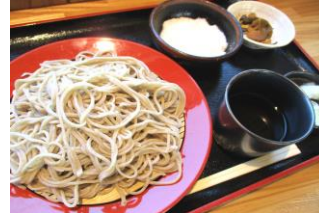
青木村特産 タチアカネ使用 とろろざる 1100円