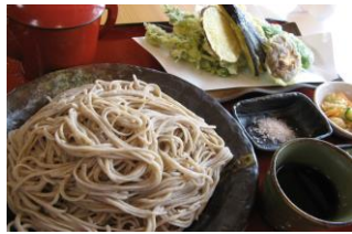
青木村特産 タチアカネ使用 天ざるそば 1250円