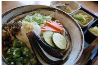
こまゆみ冷やしうどん 800円