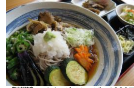
青木村特産 タチアカネ使用 こまゆみ冷やしそば 1020円