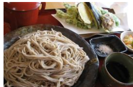
青木村特産 タチアカネ使用 天ざるそば 1280円