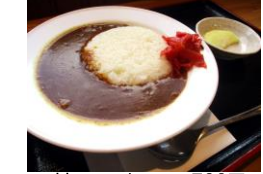
甘口ミニカレー 500円