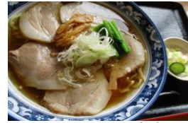
チャーシューメン 870円