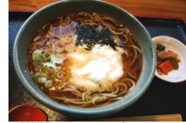
青木村特産 タチアカネ使用 とろろそば 1130円