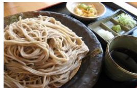
青木村特産 タチアカネ使用 ざるそば 900円