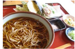
青木村特産 タチアカネ使用 天ぶらそば 1280円