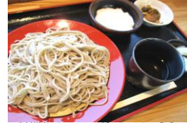
青木村特産 タチアカネ使用 とろろざる 1130円