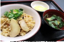
松茸ごはん(お吸物付) 1,300円