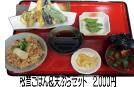
松茸ごはん&天ぶらセット 2,000円 ・松茸ごはん ・松茸のお吸いもの ・天ぶら ・小鉢 お新香