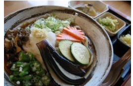
こまゆみ冷やしうどん 870円