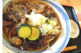
青木村特産 タチアカネ使用 きのこそば 1230円