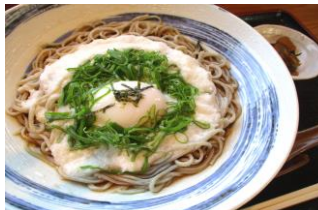
青木村特産 タチアカネ使用 冷やしとろろそば 1100円