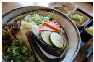
こまゆみ冷やしうどん 800円