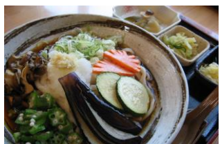
こまゆみ冷やしうどん 800円