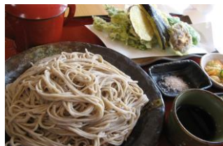
青木村特産 タチアカネ使用 天ざるそば 1250円