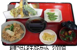
松茸ごはん&天ぶらセット 2,000円 ・松茸ごはん ・松茸のお吸いもの ・天ぷら ・小鉢 お新香