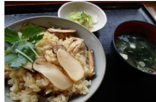
松茸ごはん(お味噌汁付) 1,300円