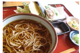
青木村特産 タチアカネ使用 天ぶらそば 1250円