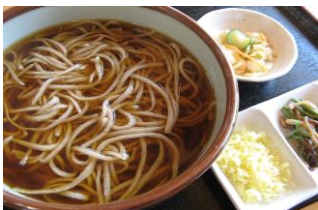
青木村特産 タチアカネ使用 掛けそば 880円