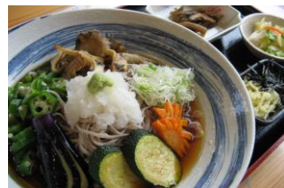
こまゆみ冷やしそば 1000円