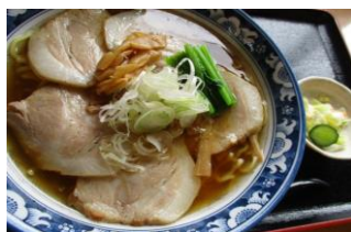
チャーシューメン 800円