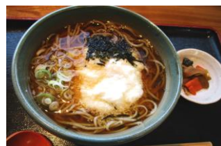
青木村特産 タチアカネ使用 とろろそば 1100円