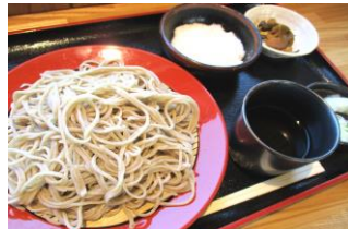
青木村特産 タチアカネ使用 とろろざる 1100円