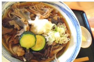
青木村特産 タチアカネ使用 きのこそば 1200円