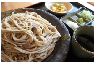
青木村特産 タチアカネ使用 ざるそば 880円