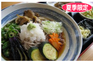
青木村特産 タチアカネ ⑤こまゆみ冷やしそば 1,200円