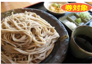
青木村特産 タチアカネ ①ざるそば 1,000円