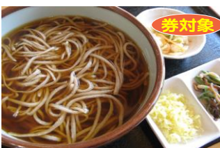
青木村特産 タチアカネ ⑥掛けそば(温) 1,000円