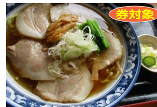
⑳チャーシューメン 1,000円