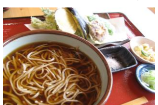
青木村特産 タチアカネ ⑧天ぶらそば(温) 1,350円