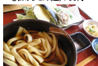
⑯天ぶらうどん(温) 1,100円