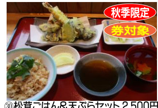
㉚松茸ごはん&天ぷらセット 2,500円