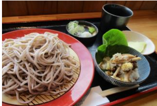
青木村特産 タチアカネ ②ざるそばと季節の小鉢 1,100円