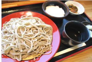
青木村特産 タチアカネ ④とろろざる 1,300円