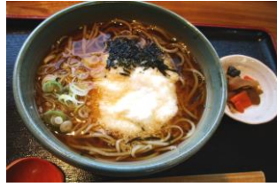
青木村特産 タチアカネ ⑨とろろそば(温) 1,300円