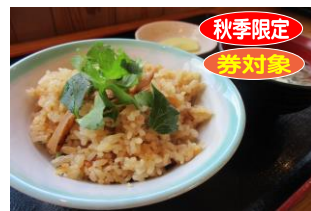
㉙松茸ごはん(お味噌汁付) 1,500円