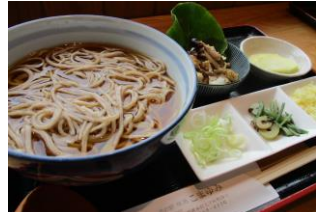
青木村特産 タチアカネ ⑦掛けそば(温)と季節の小鉢 1,100円