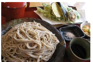
青木村特産 タチアカネ ③天ざるそば 1,350円