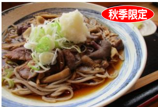
青木村特産 タチアカネ ⑩きのこそば(温) 1,400円