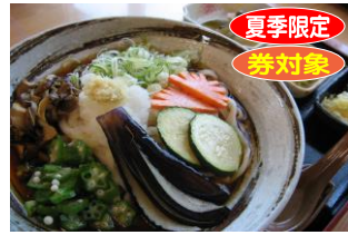
⑬こまゆみ冷やしうどん 1,000円