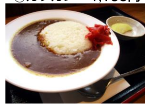
㉖甘口ミニカレー 600円