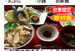
㉛松茸こまゆみセット 3,500円