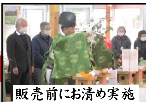
販売前にお清め実施